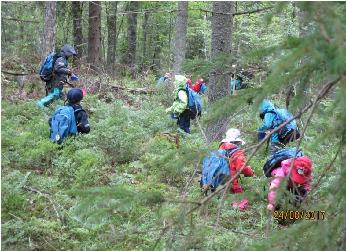
Kuva 2. Metsäretkellä