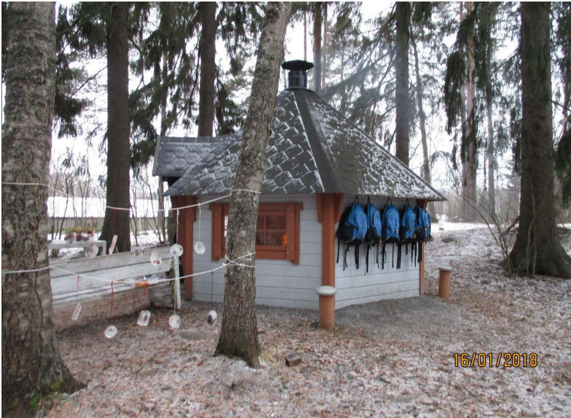
Kuva 1. Luontoesiopetus