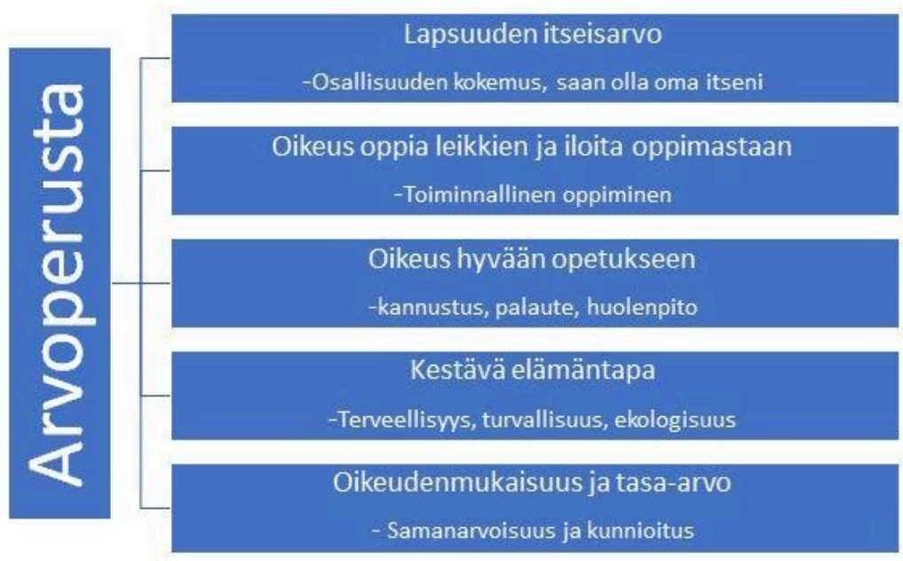
Kaavio 1. Arvoperusta