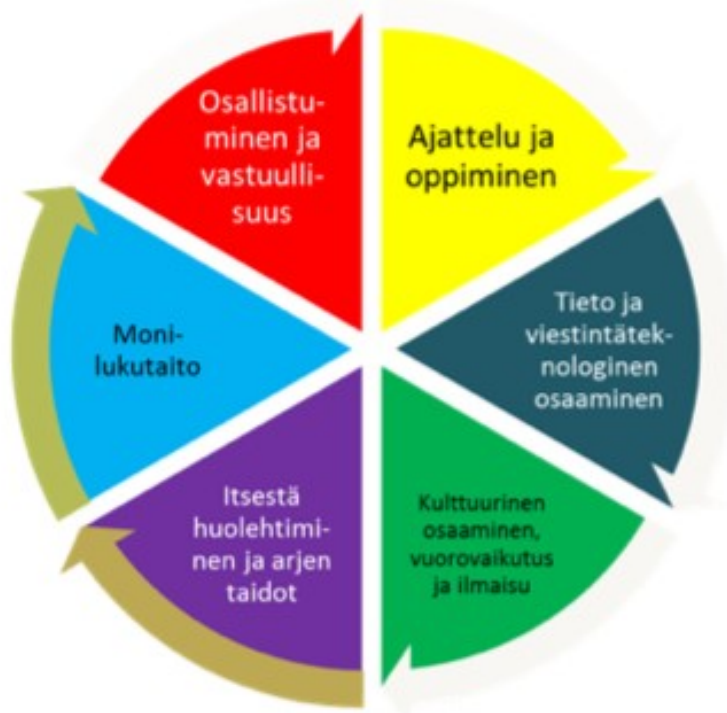
Kaavio 2. Laaja-alainen osaaminen esiopetuksessa

Mäntsälän esiopetuksessa huolehditaan, että laaja-alaisen osaamisen kaikki osa-alueet kuuluvat esiopetuksen arkeen ja ovat pohjana elinikäiselle oppimiselle. Esiopettajat arvioivat laaja-alaisen osaamisen osa-alueiden toteutumista jatkuvasti sekä toimintavuoden lopuksi yksikkökohtaisessa lukuvuosisuunnitelmassa.