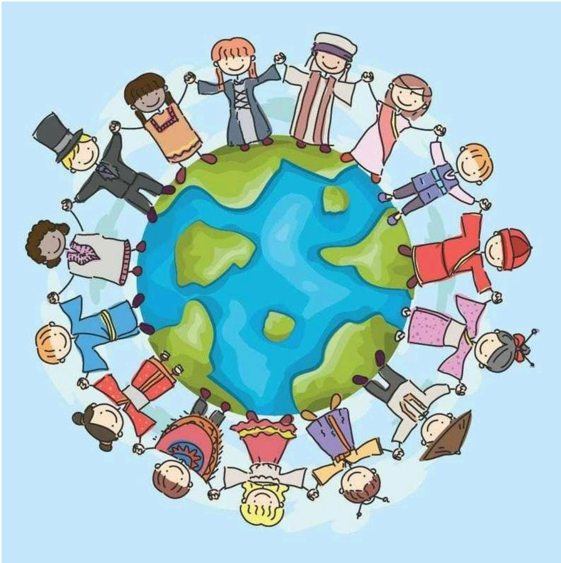
Kuva 4. peda.netin monikulttuurisesta juhlakalenterista.